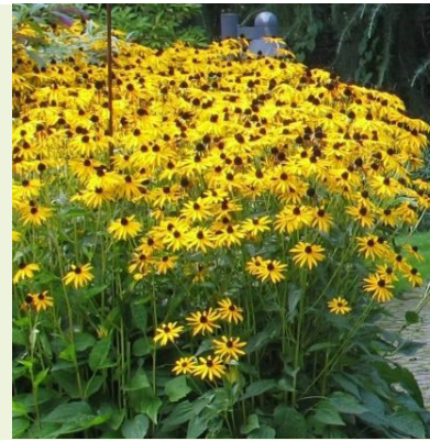
Rudbeckia fulgida 'Goldsturm' (zonnehoed) bloeit geel in juli-september, 80-100cm hoog, geeft warmte aan de border, snijbloem, is een bijenlokker