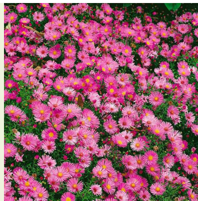
Aster dumosus 'Peter Harrison' (kussenaster) circa 40cm hoog, bloeit warm roze in september-oktober, randplant