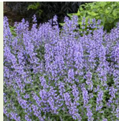
Nepeta faassenii 'Kit Cat' (kattenkruid) wordt 40 cm hoog, bloeit lila van mei/juni-augustus, geurend, vlinder- en bijenlokker