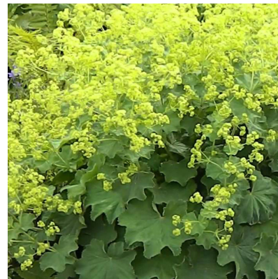
Alchemilla mollis (vrouwenmantel) bloeit geel in mei-september, bladplant, 40cm hoog, mooie randplant, water blijft in grote druppels op het