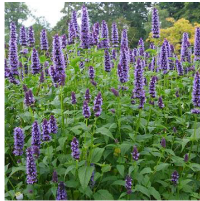
Agastache 'Black Adder' (Drooplant) Bossige plant, bloeit diep paarsblauw van juli-september, wordt 80cm hoog, trekken veel insecten aan