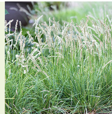
Sesleria autumnalis (herfstheidegras) groenblijvend siergras, wordt 30-50 cm hoog, bloeit met witte slanke bloemaren van sept-okt, geeft winterbeeld