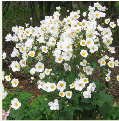
Anemone Honorine Jobert (herfstanemoon) bloeit met witte grote bloemen in september-oktober, 80cm hoog (incl. bloem)