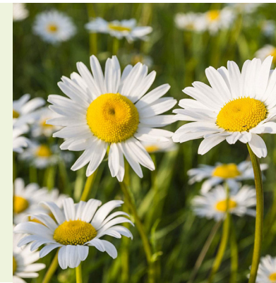
Leucanthemum vulgare 'Maikönigin' (margriet) 80cm hoog, bloeit wit van mei tot september, zonnige standplaats, snijbloem