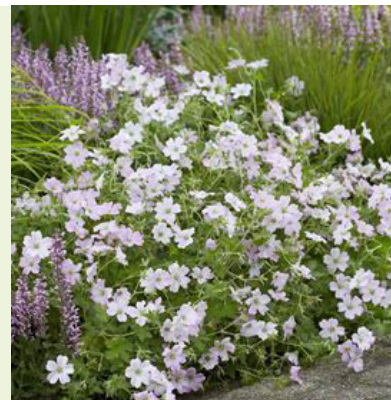
Geranium 'Dreamland' (ooievaarsbek) wordt 40cm hoog, bloeit uitbundig lichtroze in van mei tot aan de nachtvorsten, goed bodembedekkend, grijsgroen blad, bijenplant