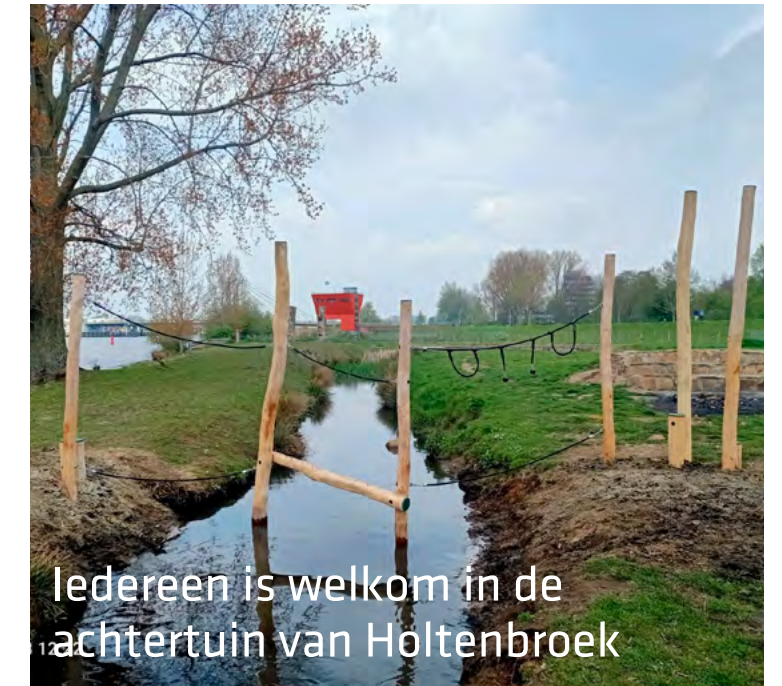
Iedereen is welkom in de achtertuin van Holtenbroek

Na de zomer ligt er een definitief ontwerp voor de dijkversterking. Wil je meer weten over de dijkversterking en wanneer het ontwerp aan bewoners wordt gepresenteerd? Volg OnzeDijkZwolle op Facebook en Instagram of ga naar www.wdodelta.nl/stadsdijkenzwolle .