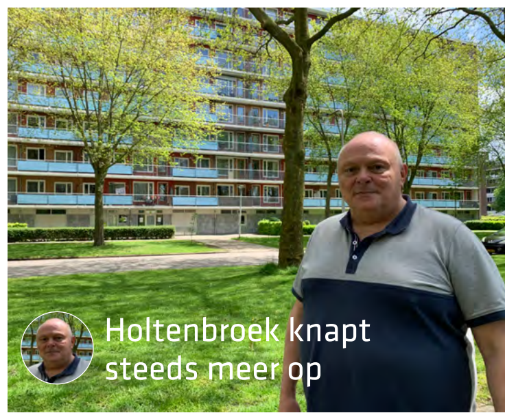
Holtenbroek knapt steeds meer op

WEETJE Holtenbroek heeft 9859 inwoners en 5011 woningen (januari 2021)