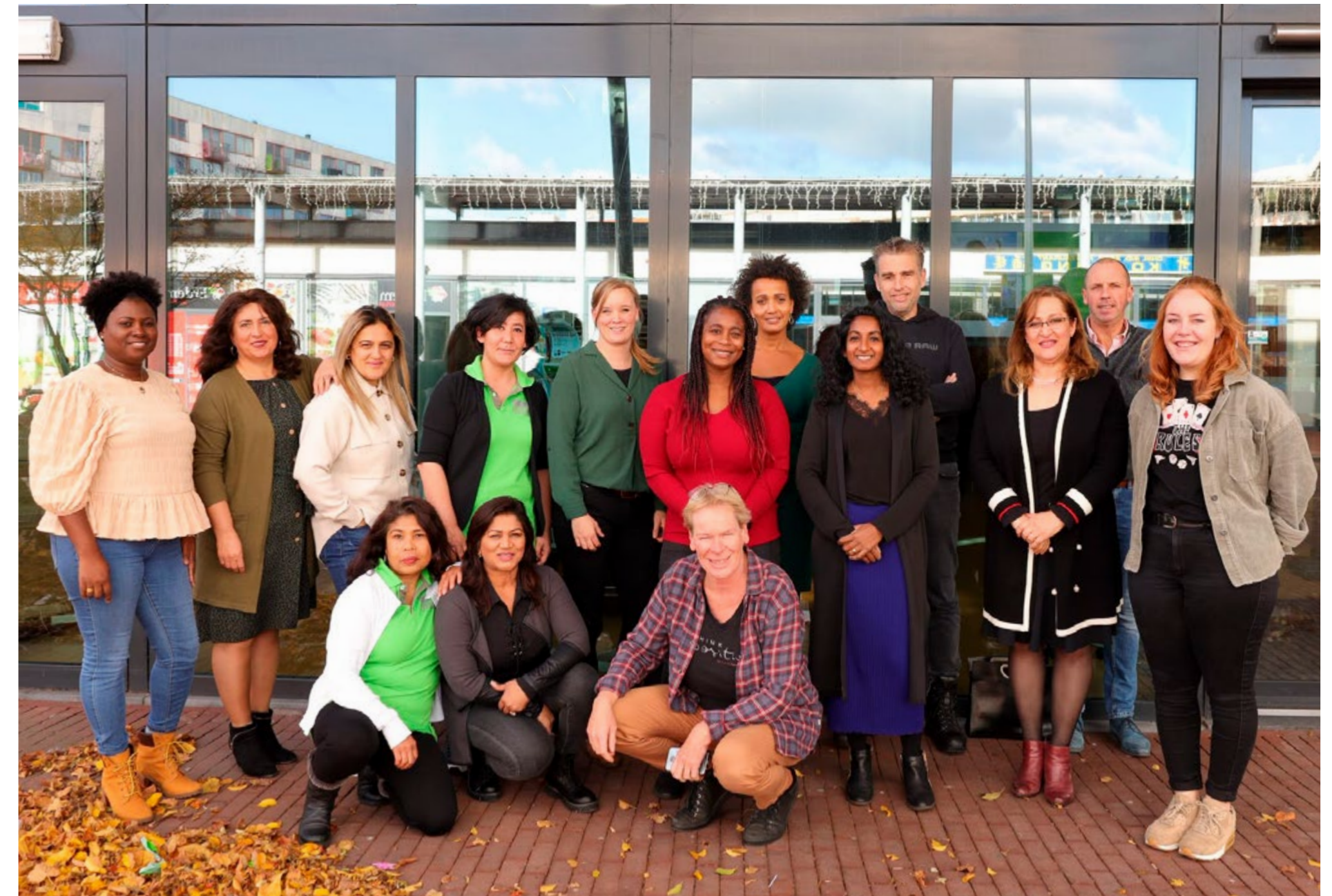
medewerkers Travers Welzijn team Noord