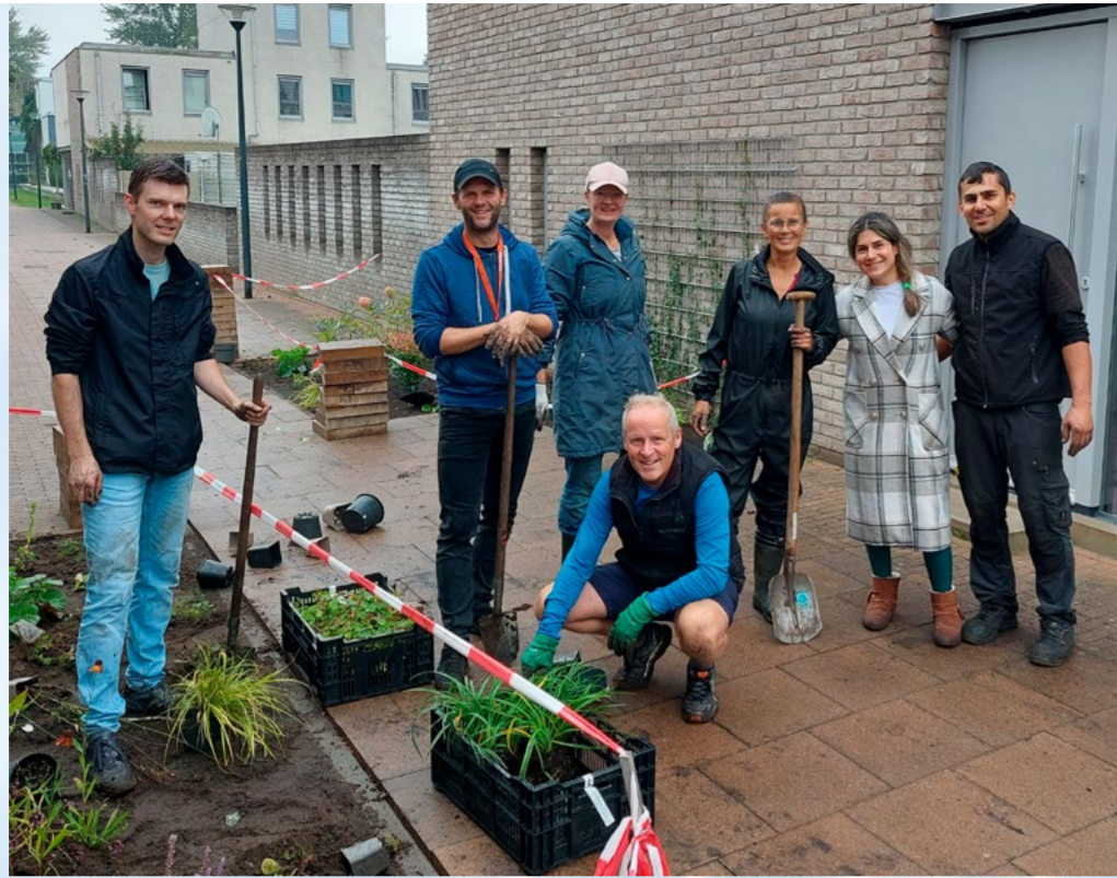
Bewoners Nicolaihof richten plantvakken in en maken de steeg veiliger