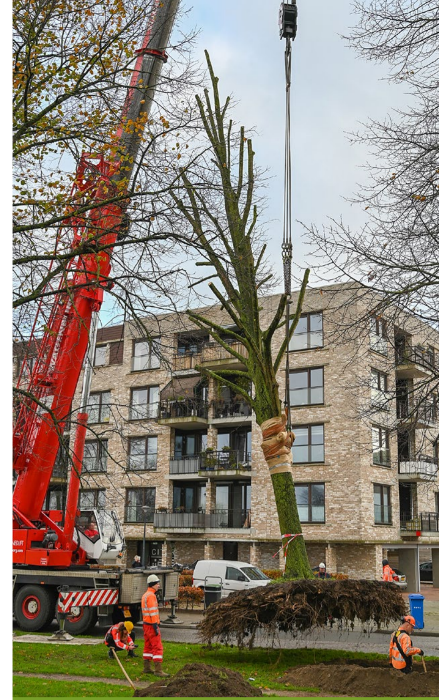
Drie volwassen bomen langs de Klooienberglaan hebben een nieuw thuis. Door de aankomende dijkversterking konden de bomen niet blijven staan op hun oude plek. Waterschap Drents Overijsselse Delta (WDOdelta) verplante de bomen naar hun nieuwe plek, zo'n 250 meter verderop.

Kijk voor meer informatie op www.palestrinalaan.nl en op pagina 4 van deze krant.