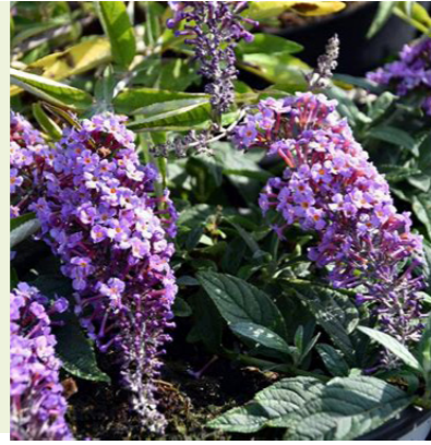
Buddleja davidii 'Lavender Flow' (vlinderstruik) lage bodembedekkender vlinderstruik, wordt 50-100cm hoog, bloeit lavendelblauw van eind juli tot september, vlinder- en bijen lokkend