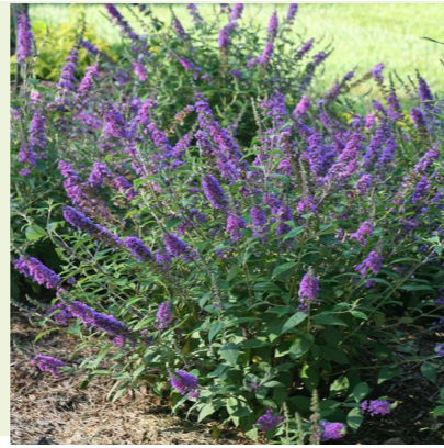
Buddleja davidii 'Blue Chip' (vlinderstruik) Compacte lage vlinderstruik, bloeit lila-blauw van juli tot de nachtvorsten, wordt 70cm hoog, grijsgroene bladeren, vlinderlokkend