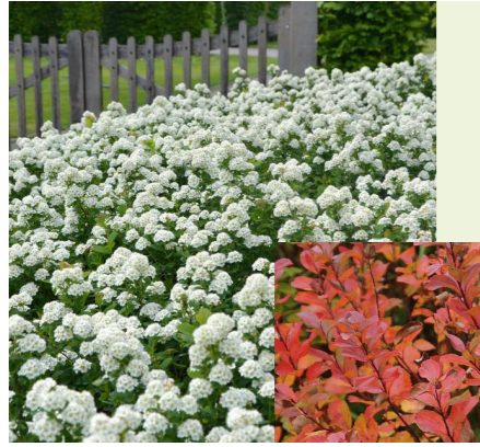
Spiraea betulifolia 'Tor' (spierstruik) Compacte struik met een dichte structuur, tot 80cm hoog en breed uitgroeiend, bloeit wit in mei, prachtige orangerode herfstkleur, zon of halfschaduw