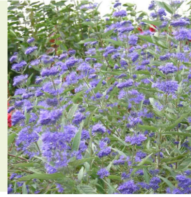
Caryopteris clandonensis 'Heavenly Blue' (blauwbaard) Brede en ronde struik, wordt 80-100cm hoog, bloeit violet-blauw van augustus-oktober, kan tegen droogte, volle zon, waardevol voor bijen en hommels

(Een van beide vlinderstruiken, afhankelijk van standplaats ivm de hoogte)