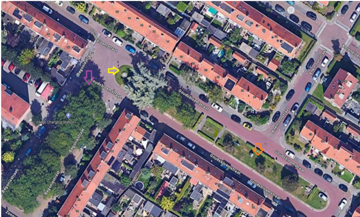
Voorbeeld als inspiratie voor aanpakken speeltuintje: (zie linker oranje pijl op plattegrond)