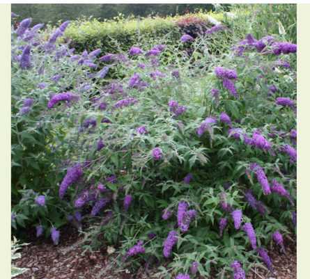
Buddleja davidii 'Dart's Purple Rain' (vlinderstruik)

Wordt tot 90cm hoog, sierlijke opgaande plant, bloeit met witte-lichtroze bloemen van juli tot oktober, zon en halfschaduw