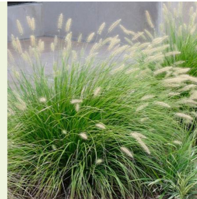
Pennisetum 'Little Bunny' (lampenpoetsersgras)

wordt 15-20cm hoog, bloeit roze-paars van juni-augustus, bodembedekkend en bossige groeiwijze, kleine bladeren, zon tot halfschaduw