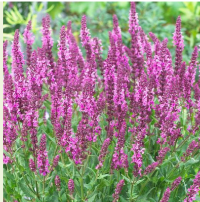
Salvia nemorosa 'Sensation Deep Rose' (salie)

wordt 50cm hoog, bloeit zachtgeel van juli-september, lichtgeurende bloemen, bijen- en vlinderlokkend, zonnige standplaats tot halfschaduw