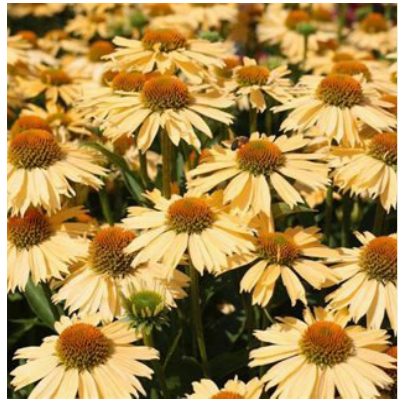
Echinacea 'Sensation Honey-gold' (zonnehoed)

Tot 1,5m hoog, compactere vorm, paars-rode bloemen, lange bloei van juli tot oktober, jaarlijks snoeien in maart