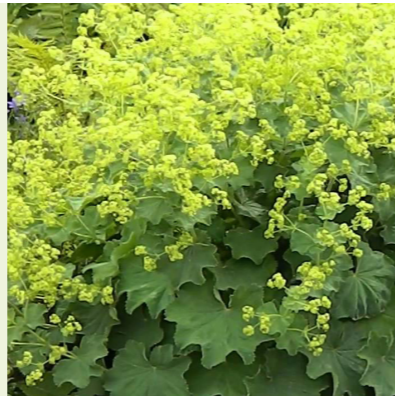
Alchemilla mollis (vrouwenmantel)

wordt 40 cm hoog, bloeit lila van mei/juni-augustus, geurend, vlinder- en bijenlokker