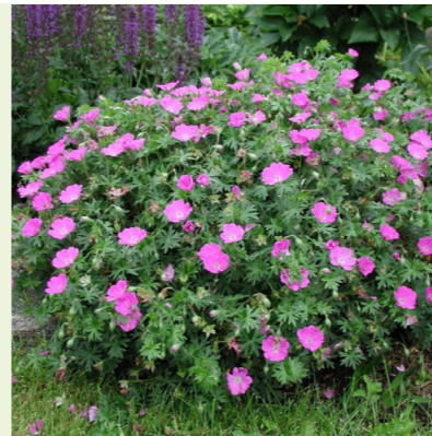
Geranium sanguineum 'Max Frei' (ooievaarsbek)

wordt 50cm hoog, bloeit goudgeel in juni-juli, nabloeiend tot in sept, opvallend door zijn blad