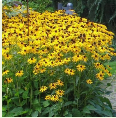
Rudbeckia fulgida 'Goldsturm' (zonnehoed)

Bossige plant, bloeit diep paarsblauw van juli-september, wordt 80cm hoog, trekken veel insecten aan