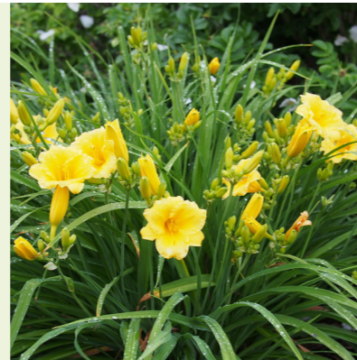
Hemerocallis 'Stella de Oro' (daglelie)

wordt 40-50cm hoog, bloeit opvallend roze met rechtopstaande aren in juni-juli, bijen- en vlinderlokkend, compacte groeiwijze, droogtetolerant, grijsgroene bladeren, zonnige standplaats