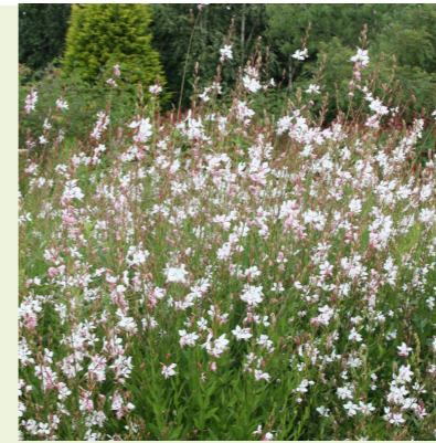
Gaura lindheimeri 'Whirling Butterflies' (prachtkaars)

80cm hoog, bloeit wit van mei tot september, zonnige standplaats, snijbloem