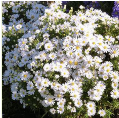
Aster dumosus 'Apollo' (herfstaster)

siergras, wordt 30-40cm hoog, bloeit met lichtbruine tot witte bloemaren van aug-okt, geeft winterbeeld, zonnige standplaats