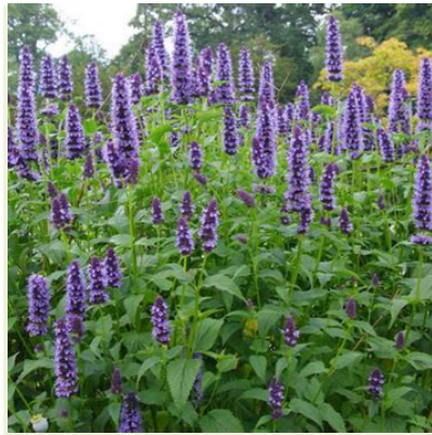
Agastache 'Black Adder' (Dropplant)

Bossige plant, bloeit diep paarsblauw van juli-september, wordt 80cm hoog, trekken veel insecten aan