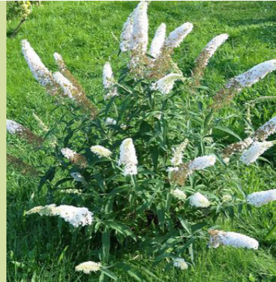
Buddleja 'Free Petite Snow White' (vliedstruik) lage bodembedekkender vliedstruik, compacte heester, wordt 70cm hoog, bloeit van juli tot september, vlinder- en bijenlokkend