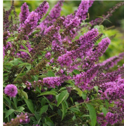
Buddleja 'Free Petite Dark Pink' (vliedstruik) lage bodembedekkender vliedstruik, wordt 50-100cm hoog, bloeit donker-roze van eind juli tot september, vlinder- en bijenlokkend