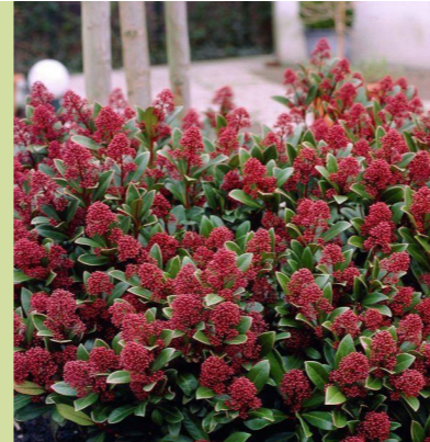
Skimmia japonica 'Rubella' (skimmia) wordt 80cm tot 1m hoog, wintergroene heester, wordt breed, bloeit witroze van april-mei met rode bloemknoppen in de winter, halfschaduw of schaduw