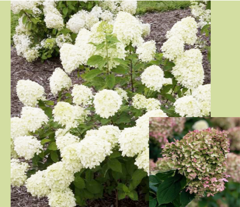
Hydrangea paniculata 'Little Lime' (pluimhortensia) wordt 1m hoog, bloeit wit met met grote bloempluimen van juli tot november, hoe armer de grond hoe witter de bloemen, in het najaar roze verkleurend