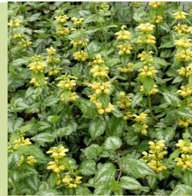
Lamium strum galeobdolon' (gele dovenetel) kruipende wintergroene bodembedekker, bloeit geel van april-juni, heeft een groen-wit blad, wordt 25cm hoog, kan goed tegen schaduw en droogte