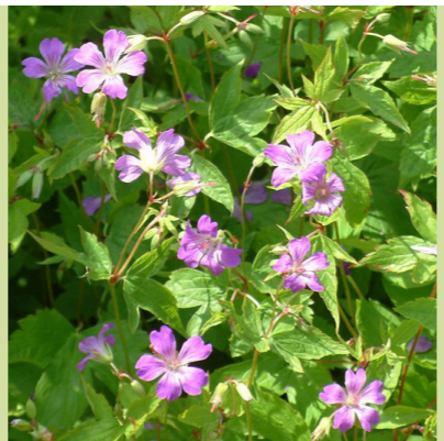
Geranium nodosum (ooievaarsbek) bodembedekker, bloeit lila in juni-juli, 40cm hoog, een geranium voor de schaduw, (is er ook in het wit)