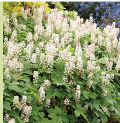
Tiarella cordifolia (schuimbloem) bloeit wit in april-mei, heeft een frisgroen blad, kruipende groei, wordt 20cm hoog