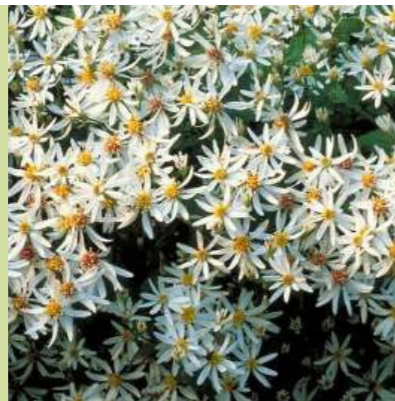
Aster divaricatus (sneeuwaster) wordt 70 cm hoog, bloeit met veel kleine witte bloemen van aug-okt, insectenlokker, kan goed tegen droogte, zowel in zon als schaduw