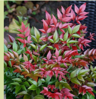
Nandina domestica 'Obsessed' (Hemelse bamboe) Compacte wintergroene heester met rood uitlopend blad, wordt 60-80cm hoog, winterbeeld is groen-purperrood, bloeit wit in juni