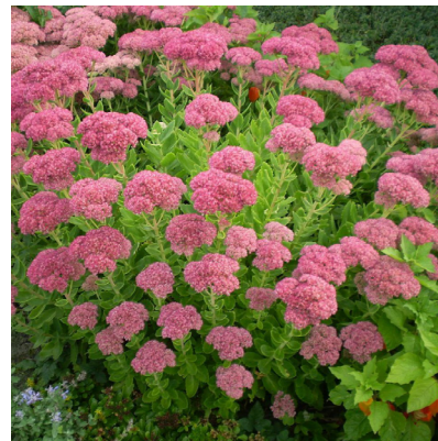
Sedum spectabile 'Herbstfreude' (hemelsleutel) Bossige plant, bloeit roze in september. 50cm hoog, herfstbloei, geeft ook in de winter beeld door de stengels