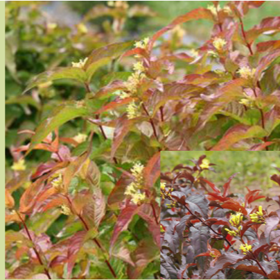
Diervilla splendens (diervilla) Wordt tot 1m hoog, sterke en kleurrijke heester door zijn rood-bruin uitlopend blad, bloeit heldergeel van juni-augustus, herfstkleur, waardevol voor bijen en hommels