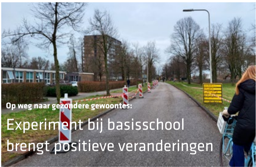
Op weg naar gezondere gewoontes:

De Grote Peuter Dag is ook meteen een open dag. Op deze dag organiseren wij 'De Toonladder bakt voor heel Holtenbroek'. Onze leerlingen bakken de lekkerste taarten, cakejes en koekjes. Kom gezellig langs in ons restaurant voor koffie, thee en baksels! Ook zijn er rondleidingen en voor de kleintjes worden leuke activiteiten georganiseerd.