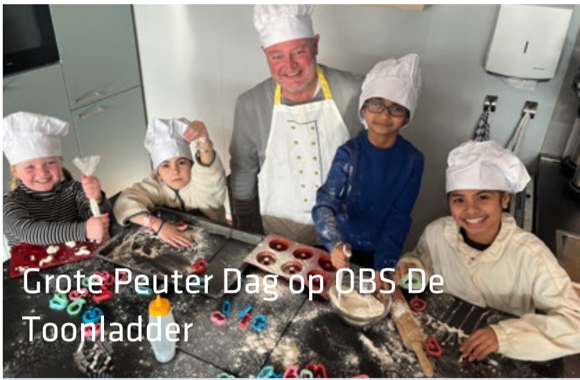
Grote Peuter Dag op OBS De Toonladder