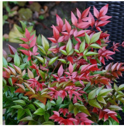
Nandina domestica 'Obsessed' (Hemelse bamboe) Compacte wintergroene heester met rood uitlopend blad, wordt 60-80cm hoog, winterbeeld is groen-purperrood, bloeit wit in juni