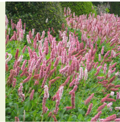
Persicaria affinis 'Darjeeling Red' (duizendknoop) bloeit lichtroze van juni-oktober, maar de bloemknoppen geven een donkere kleur, 20cm hoog, goede bodembedekker, bijenplant, wintergroen