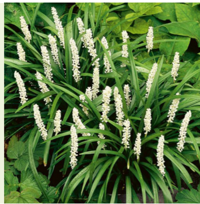
Liriope muscari 'Monroe White' (leliegras) wordt 30cm hoog, bloeit wit in juli-augustus, wintergroen gras-achtig blad