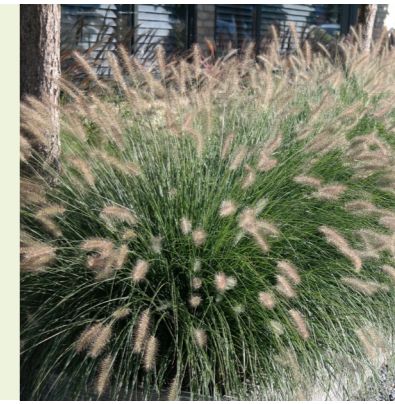
Pennisetum 'Hameln' (lampenpoetersgras) siergras, wordt 80cm hoog, bloeit met lichtbruine tot witte bloemaren van juli-sept, geeft winterbeeld