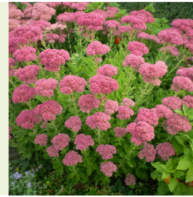
Sedum spectabile 'Herbstfreude' (hemelsleutel) Bossige plant, bloeit roze in september, 50cm hoog, herfstbloei, geeft ook in de winter beeld door de dikke stengels