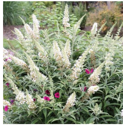
Buddleja 'White Ball' (Vlinderstruik) Ronde struik, wordt circa 1m hoog, bloeit met witte pluimen van juli tot september, vlinderlokkend