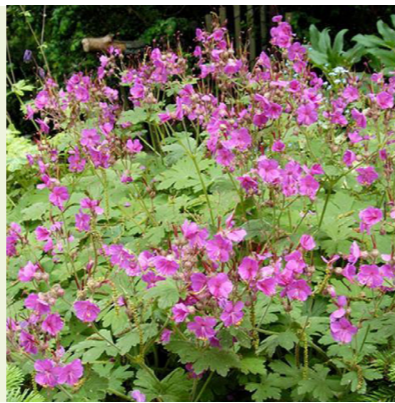
Geranium macrorrhizum 'Bevan's Variety' (ooievaarsbek) wordt 40cm hoog, bloeit uitbundig rozerood van mei tot juli, is half wintergroen en goed bodembedekkend, in de herfst verkleurt het blad rood, bijenplant