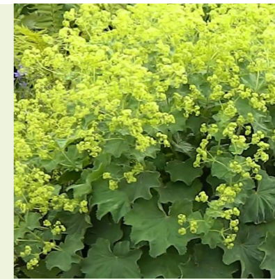
Alchemilla mollis (vrouwenmantel) bloeit geel in mei-september, bladplant, 40cm hoog, mooie randplant, water blijft in grote druppels op het blad liggen