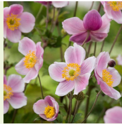
Anemone hupehensis 'September Charm' (herfstanemoon) 80-100cm hoog, bloeit zachtroze van augustus tot oktober, groeit ook goed in de halfschaduw